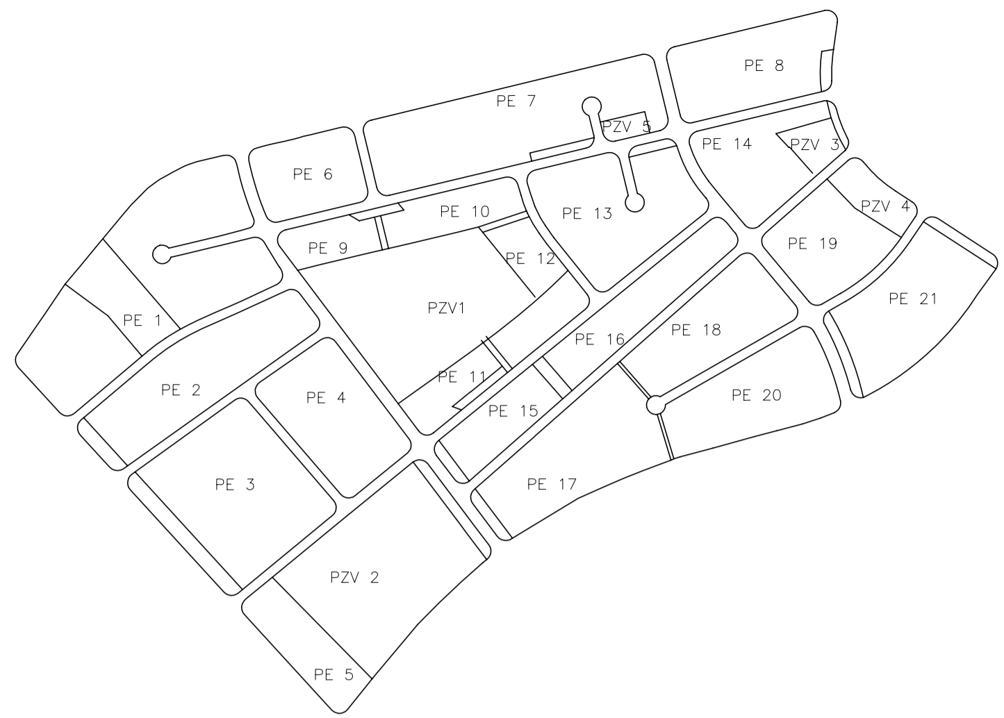
DENOMINACION PARCELARIO/MANZANAS EDIFICABLES 1:5.000

Las dimensiones de este plano no deben cambiarse de escala. Todas las cotas deben comprobarse "in situ". Este plano debe interpretarse conjuntamente con el resto de planos relevantes del Plan Parcial del Polígono 28 y sus modificaciones. En caso de contradicciones en los planos, se estará a lo que determine el de escala mayor. Este plano no es válido sin el sello de Visado Colegial. Este plano forma parte del la Modificación Puntual del Plan Parcial del Polígono 28 para su aprobación por el Ayuntamiento, y no será válido sin la diligencia municipal y la firma del Secretario. Los planos integrantes de la Modificación Puntual de Plan Parcial solo podrán usarse para la ejecución del Planeamiento que constituye su objeto y en el emplazamiento previsto.