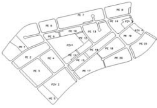
SEÑALACION PARCELARIO/ÁREAS EDIFICABLES 1:5.000